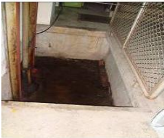
地下室之升降梯孔積水